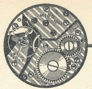
10 1/2''' - 1002